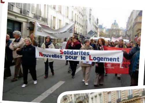
Manifestation 24h pour le logement : urgence ! 10 novembre 2011

Le Livret Agir SNL, est un placement sûr, dont la rentabilité est garantie, dont l'utilité sociale est maximale. Donnons du sens à notre épargne avec SNL...et faisons le savoir autour de nous.