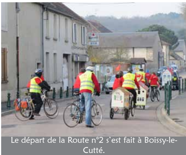
Le départ de la Route n°2 s'est fait à Boissy-le-Cutté.

Point de départ à Boissy-le-Cutté, organisation de la caravane : une voiture avec la petite maison SNL ouvre la route, suivie de deux cyclistes tractant chacun une petite maison, (fabriquées par des bénévoles des groupes Janville/Lardy et Bouray), accompagnés d'une dizaine de cyclistes, et de trois ou quatre voitures suiveuses, tout le monde aux couleurs SNL. Toute cette caravane va rejoindre Cerny en se faisant remarquer !