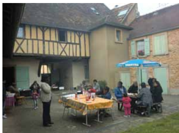
Fête des Voisins à la Pension de famille de Bruyères-le-Châtel