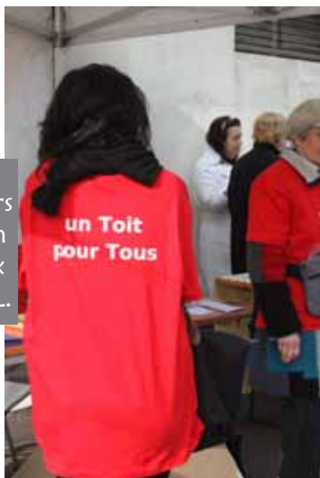
Les ambassadeurs portaient un tee-shirt aux couleurs SNL.

Parmi les ambassadeurs une personne fait un essai pour devenir éventuellement bénévole, et une autre a promis de nous rejoindre à la rentrée.