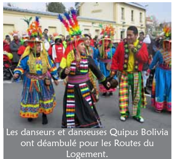
Les danseurs et danseuses Quipus Bolivia ont déambulé pour les Routes du Logement.