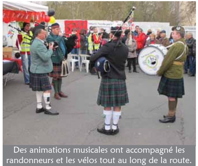
Des animations musicales ont accompagné les randonneurs et les vélos tout au long de la route.

La route s'est terminée à Marolles autour d'un repas convivial avec une ambiance à la hauteur de la manifestation de la journée.