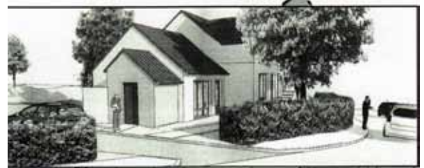
Le projet de cinq logements SNL à Lardy.

Coopérant à SNL depuis plusieurs années, nous avons repéré un terrain libre à Lardy. Un projet de construction pour SNL nous semblait possible. D'où l'envie qui nous a pris de créer un Groupe sur Janville/Lardy pour donner corps à ce projet (à noter que deux Groupes SNL y avaient déjà existé il y a plusieurs années).