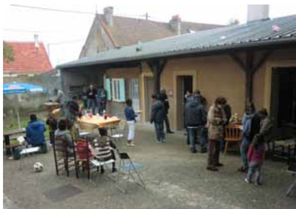
Fête des Voisins à la Pension de famille de Bruyères-le-Châtel.