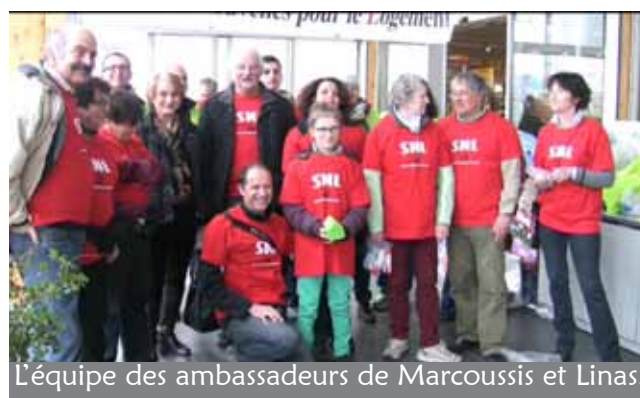
L'équipe des ambassadeurs de Marcoussis et Linas.