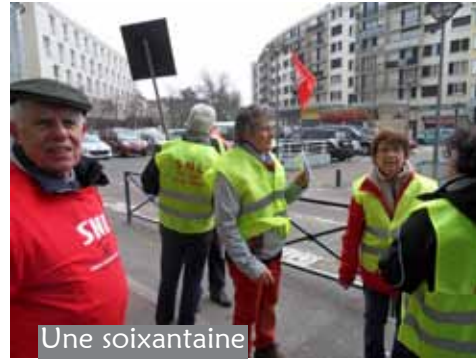
Une soixantaine de marcheurs sont allés dans les rues de Ste-Geneviève-des-Bois et de St-Michel.

Des partenaires, tellement enthousiasmés par l'atmosphère de la journée, se portent candidats pour renouveler l'expérience avec nous ! Cependant pas de nouveaux bénévoles, mais nous venions de faire le plein !