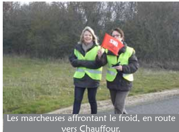
Les marcheuses affrontant le froid, en route vers Chauffour.