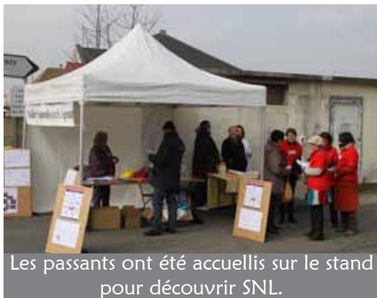
Les passants ont été accueillis sur le stand pour découvrir SNL.