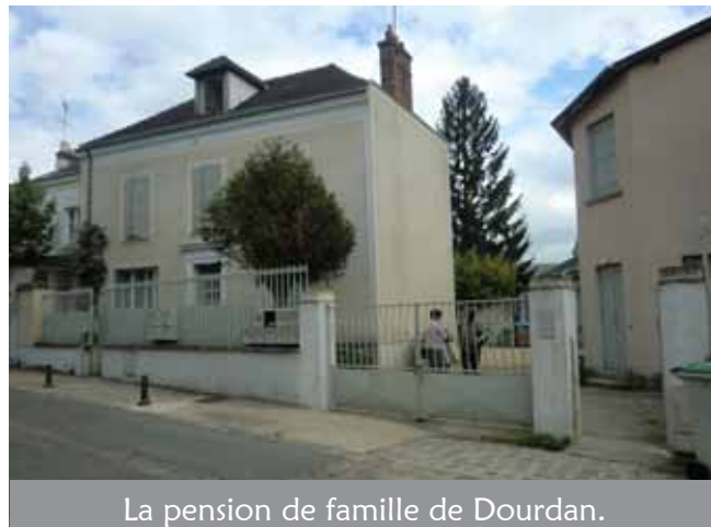
La pension de famille de Dourdan.

De plus, deux fois par mois, les trois hôtes et France font le point au cours d'une réunion de synthèse.