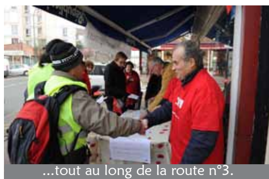
...tout au long de la route n°3.