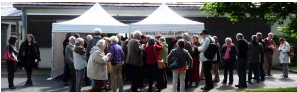
Les participants à l'AG se sont retrouvés dehors pour un apéritif convivial.