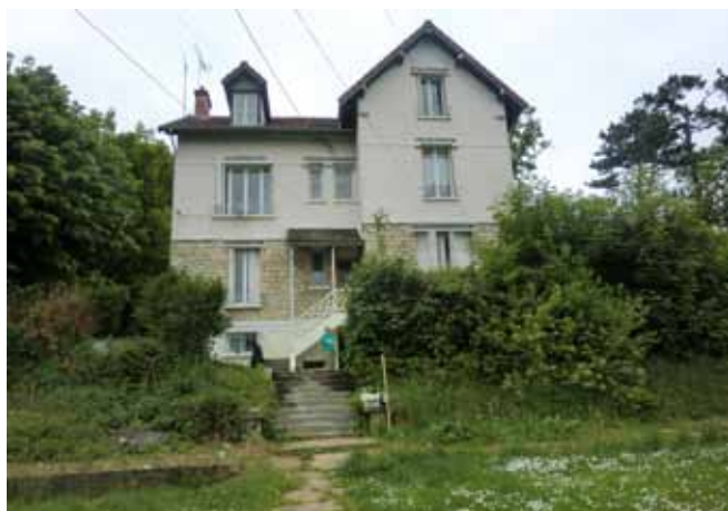
Étampes, promenade de Guinette.