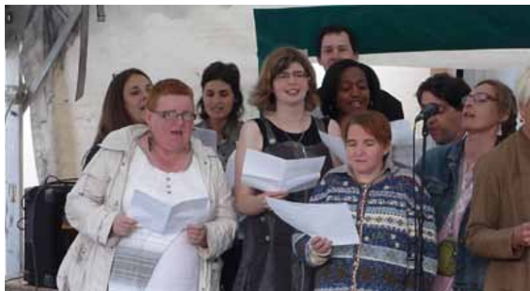
... et applaudissent !