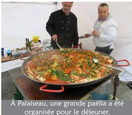
À Palaiseau, une grande paëlla a été organisée pour le déjeuner.