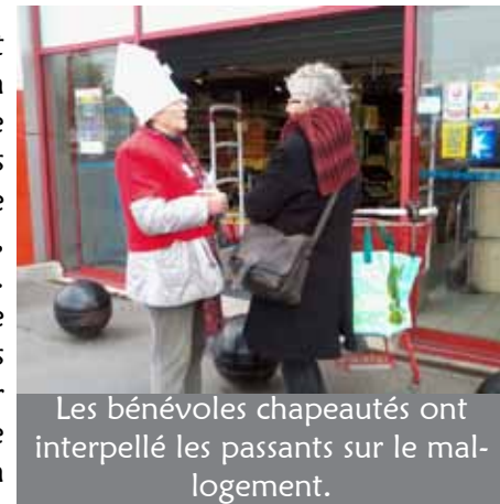
Les bénévoles chapeautés ont interpellé les passants sur le mal-logement.