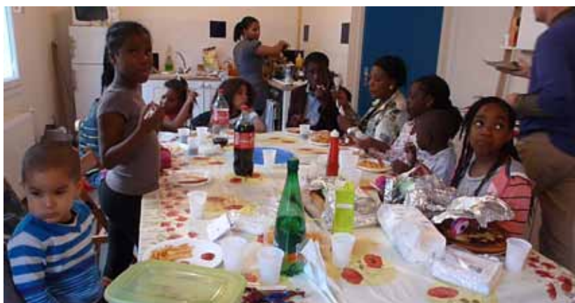
Fête de la Musique à la Pension de famille de Palaiseau : les petits...