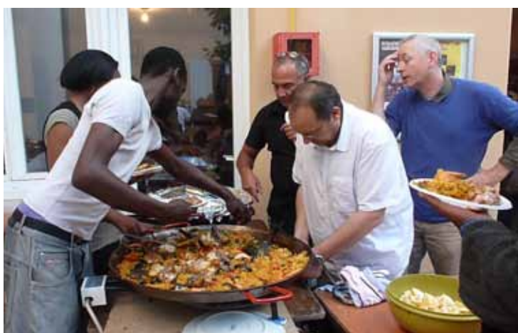
... et les grands se régalaient...