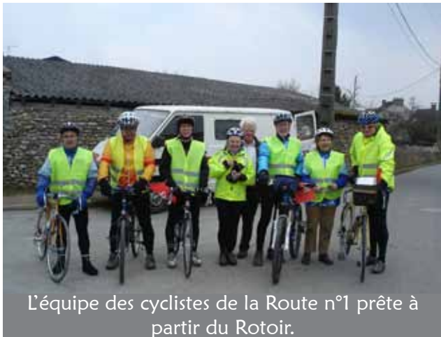
L'équipe des cyclistes de la Route n°1 prête à partir du Rotoir.