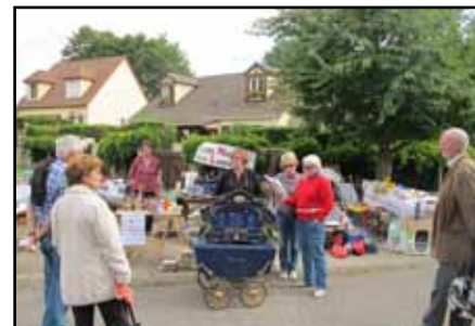
SNL sur la brocante à Janville.

Dans la même logique, nous essayons de mettre en œuvre tout ce qui est possible pour nous faire connaître. Sur ces deux villages, des personnes actives nous aident et sont très ouvertes pour œuvrer avec nous pour que chacun ait « un toit au-dessus de sa tête ».