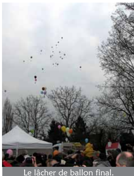
Le lâcher de ballon final.