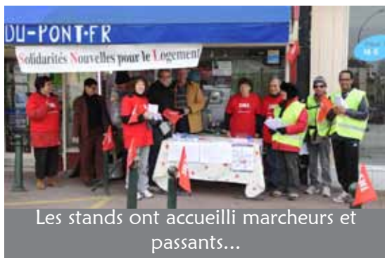
Les stands ont accueilli marcheurs et passants...