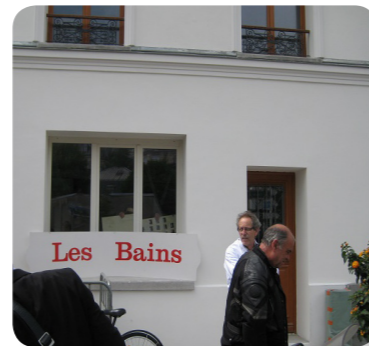
Immeubles des Bains à Colombes (SNL 92)

Pour chacun, des indicateurs sont en cours de finalisation, indicateurs dont l'Essentiel SNL 2014 devrait profiter.