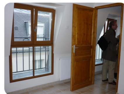
Logement rue Charlet (SNL 75)

Réponse attendue en avril 2014, mais d'ores et déjà nous mettons en œuvre les recommandations faites par les enquêteurs dont une information annuelle de l'ensemble SNL à destination des donateurs. C'est l'objet de cet Essentiel SNL 2013.