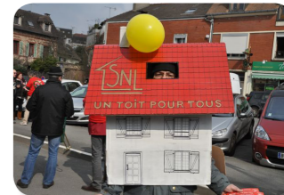
Les routes du logements 2013 (SNL 91)

Solidarités Nouvelles pour le Logement : donner à vivre « Habiter est pour tout homme une nécessité première » (Charte SNL) « La nécessité est la mère de l'invention » (Platon – la République) « Nécessité fait loi » (Proverbe)