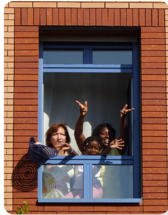
Membres de SNL dans un logement à Saint-Maur-des-Fossés (SNL 94)