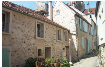
Logement à Palaiseau dans l'Essonne