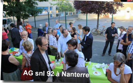
AG snl 92 à Nanterre