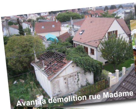
Avant la démolition rue Madame