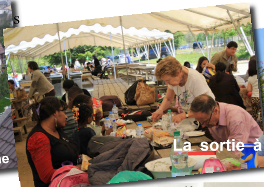
La sortie à Thoiry