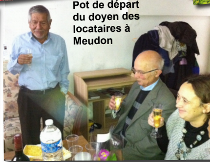
Pot de départ du doyen des locataires à Meudon