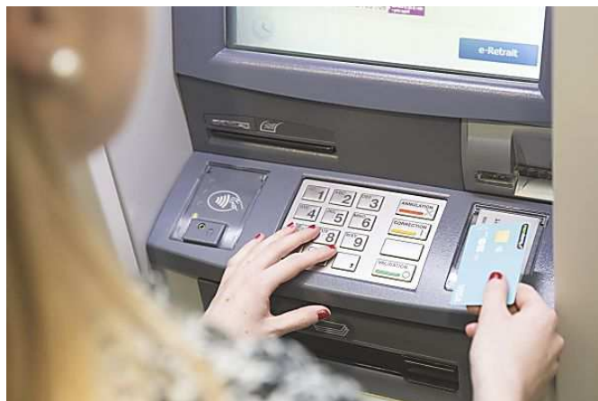
Mobilité bancaire : ce qui change avec la Loi Macron Monabanq