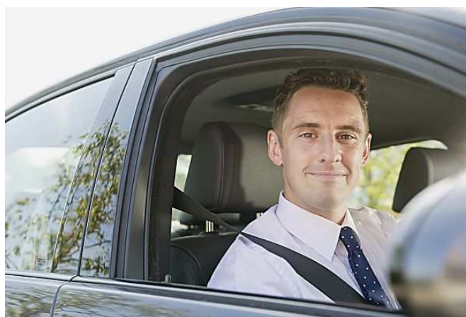
Assurance auto : vous roulez peu, pourquoi payer beaucoup ? AXA