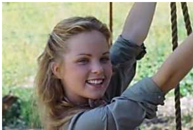
Avant/après des acteurs de La Petite Maison dans la Prairie en images ... Vous serez surpris ! Femme Actuelle