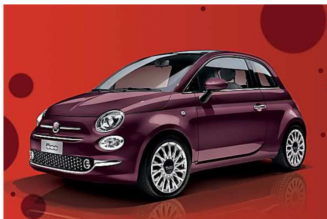
Fiat 500, un amour au caractère effronté Fiat