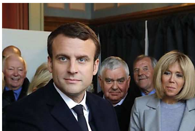
PHOTOS- Brigitte Macron déjà un look de première dame Photo