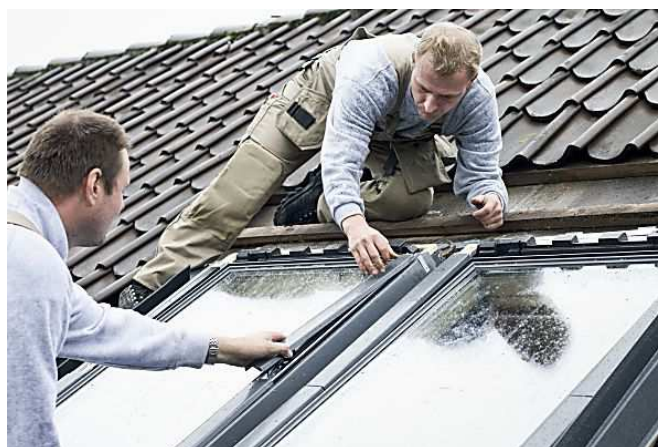
150€ remboursés pour remplacer ses anciennes fenêtres VELUX www.revedecomble.fr