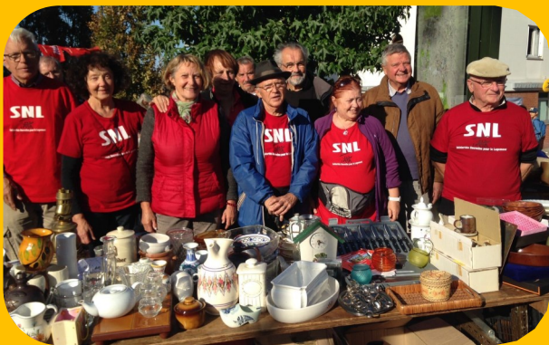
Brocante aux Clayes-sous-Bois